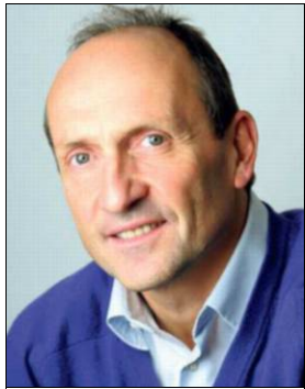
Par François KLEIN, cabinet Manadox